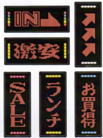
(画面は合成イメージ)